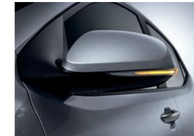
Espejos y repetidores exteriores