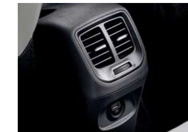
Ventilación de AC en la parte trasera