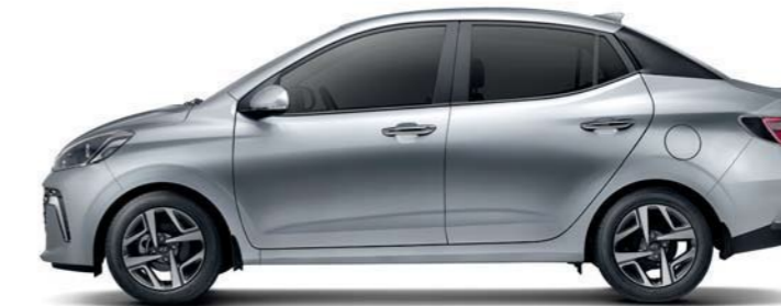
Distancia entre ejes 2,450 Longitud general 3,995