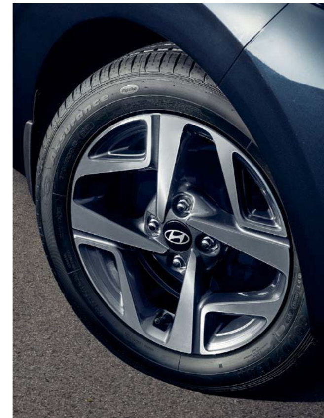
Llantas de aleación de 15" con corte de diamante