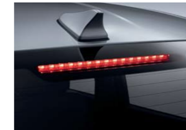
Faro de freno alto (LED)