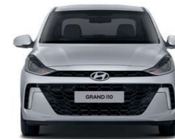
Banda de rodadura* 1,477 Ancho general 1,680