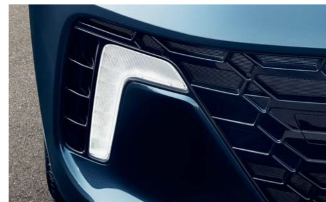
Faros de proyección Luces para circulación diurna (DRL) LED