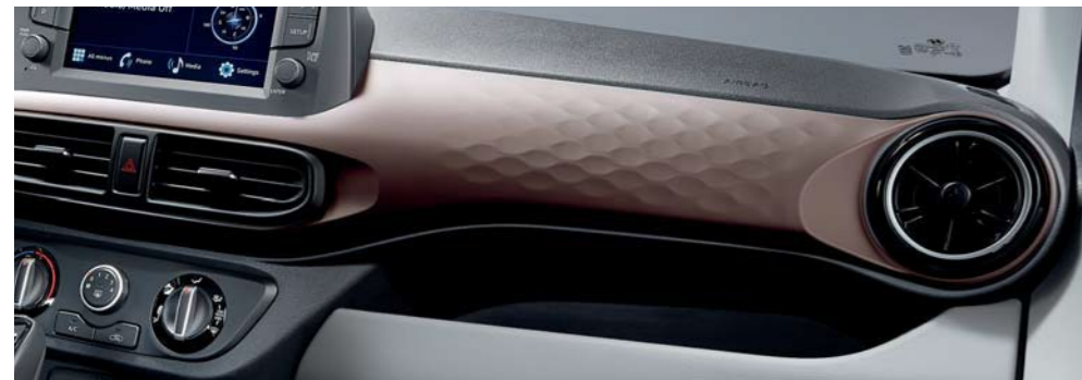
Graige en dos tonos_marrón