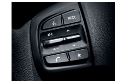
Bluetooth manos libres