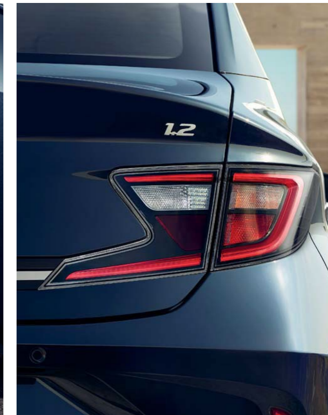
Elegantes faros traseros LED en forma de Z