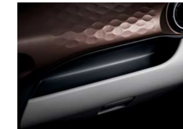
Área de almacenamiento práctica