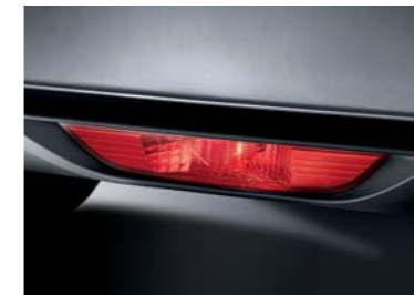
Luz antiniebla trasera