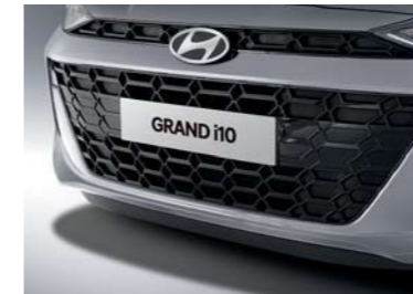
Parrilla del radiador en negro brillante