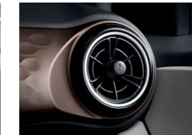
Ventilaciones de AC estilo de hélice única