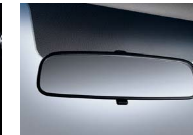
Espejo retrovisor día-noche