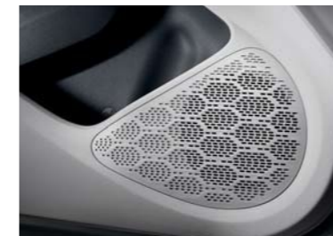
Sistema de cuatro parlantes delanteros/traseros