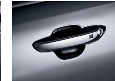
Manijas de puertas cromadas