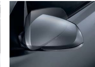
Espejos eléctricos plegables