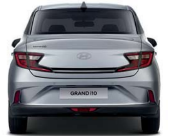
Banda de rodadura* 1,495

Unidad: mm *Rodadura: 14" (delantera y trasera) - 1,489 / 1,507