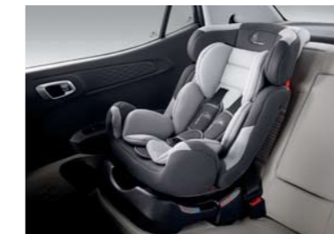
Sistema de anclaje para asientos infantiles ISOFIX